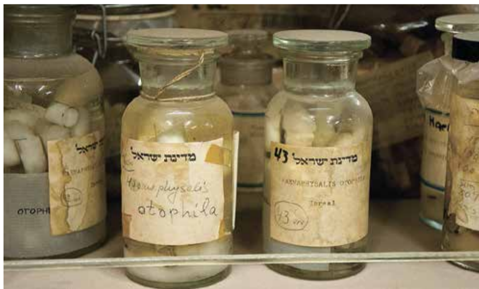
חיידקים בצנצנות בקמפוס גבעת רם שירושלים. מה גידו מפגיני בלפור

שביצעה הנהלת המגורות לפני כמה שנים בציפורים שליטקטו גרעיני תבואה סביב המגורה, ועורר סערה. עוד בין המפעלים, תצלום המבנה המקורי הנטוש של יקבי כרמל בראשון לציון – רומנטי' קה של המהפכה התעשייתית – שעקר לפני כמה שנים למרכז לוגיסטי "מצויד ומאובר" בפא' רק התעשייה אלון תבור, אחרי 130 שנה. עדויות אחרות הן מה' נה מפעלי האשלג הנטוש בקליה,