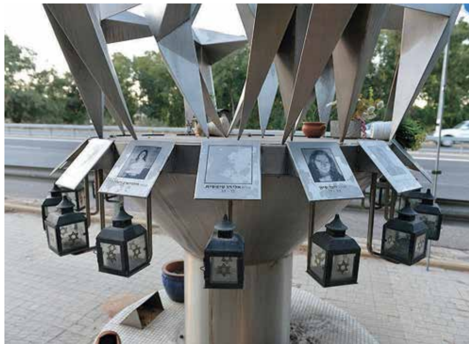
אנדרטה להרוגי הפיגוע בצומת מגידו. הרוג אחד הושכח מפני ש"נחשד" כערבי

מצודות משטרה מחוררות מתקופת המנדט הבריטי, מפעל חיפאי עם עבר מדמם ופוחלץ מעורר חלחלה של עובר אדם. הפרויקט הצילומי-אדריכלי המקוון של דנה אריאלי מתמקד ברוחות הרפאים של האידיאולוגיה הציונית